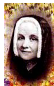
Santa Paula Frassinetti

Queremos ser "Un solo corazón y una sola alma en el Corazón Santísimo de Jesús"