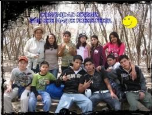
Picsi: "Jóvenes viviendo íntimamente con Cristo"