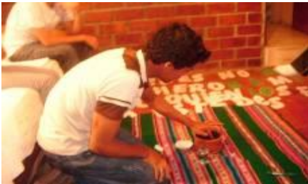
Equipo líder de coordinadores de las comunidades juveniles

En este grupo de líderes somos 10 personas (8 jóvenes del equipo coordinador y dos acompañantes, una laica y una Hermana), formamos un equipo motivado por nuestra fe que asumimos un compromiso cristiano y damos testimonio para una mejor calidad de vida.